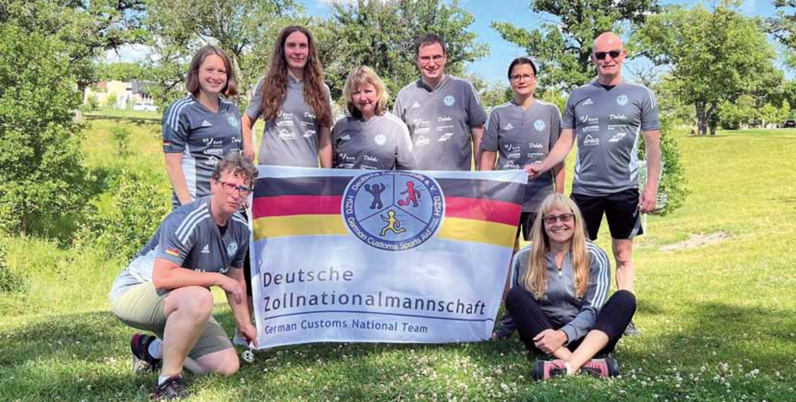
Deutsche Zollnationalmannschaft (DZNM) mit Delegation bei den WPFG in Winnipeg