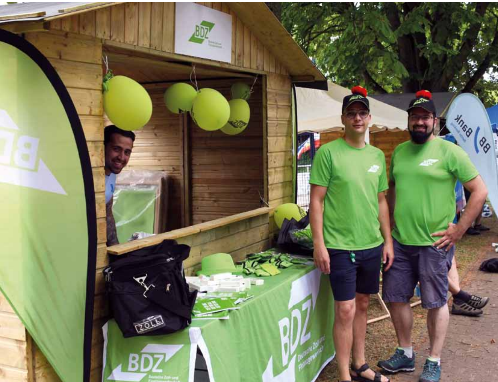
BDZ Stand auf der Eventmeile bei der 16. Deutschen Zollmeisterschaft Heidelberg 2023