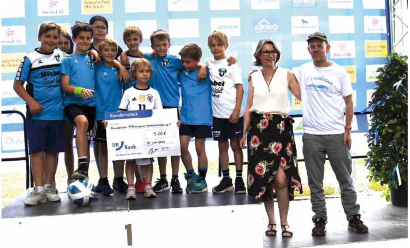
Jugend mit Betreuern des Freundeskreis Fußballjugend Handschuhsheim e.V. bei der Spendenscheckübergabe auf der Eventmeile während der 16. DZM Heidelberg 2023